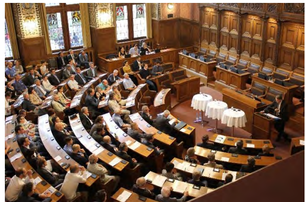
Sommeranlass vom 21. August 2017 im Grossratssaal