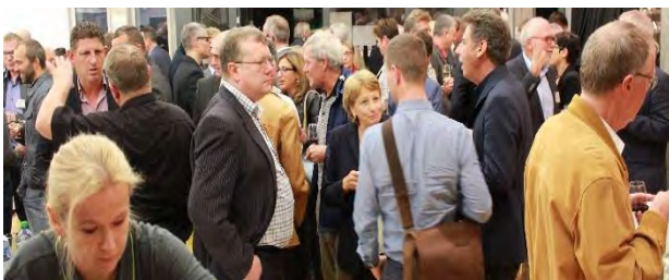
Angeregter Gesprächsaustausch während dem Apéro

Der Übergang von traditionellen zu neuen Arbeitsformen verursache heftige Turbulenzen und gehe nicht wie ein Spuk rasch vorüber. Entscheidend sei, wie wir uns damit auseinandersetzen und uns darauf vorbereiten, beispielsweise durch lebenslanges Lernen und Weiterbildung.