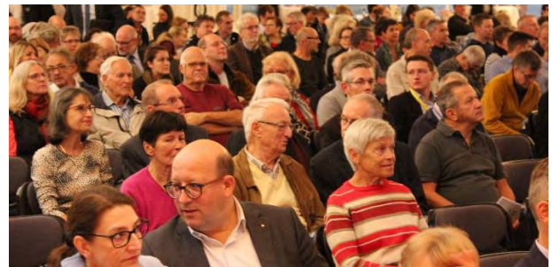
Teilnehmende vom Wirtschaftsforum Binningen 2017 im Kronenmattsaal